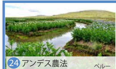
24 アンデス農法 ペルー

住民のペルペル人がアトラス山脈に築いたオアシスで多様な樹木や作物を生産するシステム