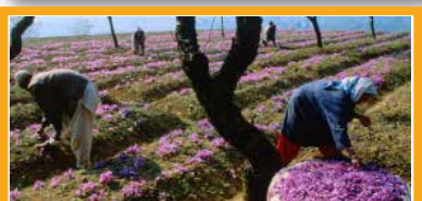
17 カシミールのサフラン農業 インド

多数の少数民族が原始的な農業生活を営み、多種の稲と固有植物が栽培されているシステム