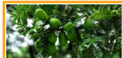
8 会稽山の古代中国カヤ林 中国

高品質な実をとるため接木の技術を用いて植栽される2千年の歴史を誇る中国カヤ林システム