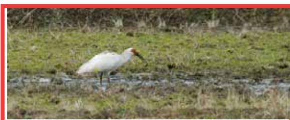
1 トキと共生する佐渡の里山 日本

新潟県の佐渡地域は、金山の歴史が生み出した棚田などの水田で、冬期湛水など「生きものはぐくむ農法」とその認証制度を推進しています。また、農業は、能、鬼太鼓などの農村文化の発展につながり、佐渡独特の自然、風景、文化、生物多様性を保全しています。