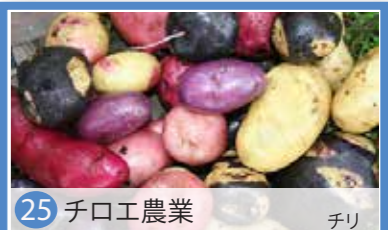
25 チロエ農業 チリ

海抜4千mのバレイショ畑の周りに溝を掘り、日射で水を温め、夜間に畑に流すシステム