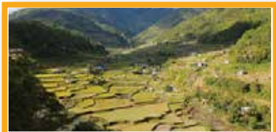
6 イフガオの棚田 フィリピン

大分県の国東半島宇佐地域は、日本一の原木乾しいたけ生産や、日本で唯一の水稲作とシチトウイを組み合わせた生産をはじめ、多様な農林水産業が営まれているシステムで、これらは日本最大のクヌギ林と、連携するため池群によって持続的に維持されています。