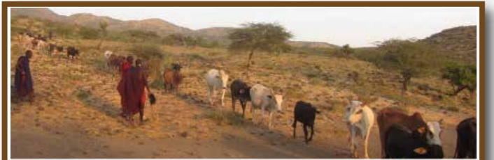
18 19 マサイ族の牧畜 タンザニア・ケニア

2500年以上受け継がれ現在も17000家族が取り組む固有のサフラン栽培システム