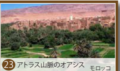
23 アトラス山脈のオアシス モロッコ

マグリブの厳しい天候の中で何千年も続いているオアシスで多様な果物や野菜を生産するシステム