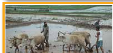
16 コラプット伝統農業 インド

多数の少数民族が原始的な農業生活を営み、多種の稲と固有植物が栽培されているシステム