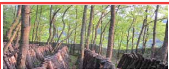
5 クヌギ林とため池がつなぐ 国東半島宇佐の農林水産循環 日本

熊本県の阿蘇地域は、千年以上続く「野焼き」などの伝統的な草原の管理方法により、木が生い茂るのを防ぎながら、あか牛の飼育に必要な草資源を確保するなど持続的な農業の営みによって雄大な自然景観を維持しています。