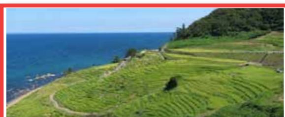
2 能登の里山里海 日本

新潟県の佐渡地域は、金山の歴史が生み出した棚田などの水田で、冬期湛水など「生きものはぐくむ農法」とその認証制度を推進しています。また、農業は、能、鬼太鼓などの農村文化の発展につながり、佐渡独特の自然、風景、文化、生物多様性を保全しています。