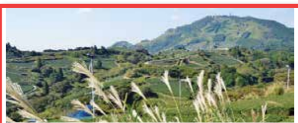
3 静岡の茶草場 日本

石川県の能登地域は、美しい農村風景が見られ、棚田やため池による里山の景観と、海女漁、揚げ浜式製塩など里海の資源を活用した伝統技術が受け継がれています。また、「あえのこと」やキリコ祭りなど、農業と結びついた風習や文化が多く残っています。