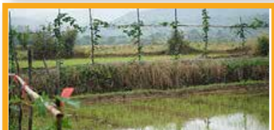
11 万年の伝統稲作 中国

1300年以上も続く特産品のぶどうが家庭の裏庭で栽培されている都市の農業システム