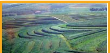
9 アオハンの乾燥地農業 中国

高品質な実をとるため接木の技術を用いて植栽される2千年の歴史を誇る中国カヤ林システム