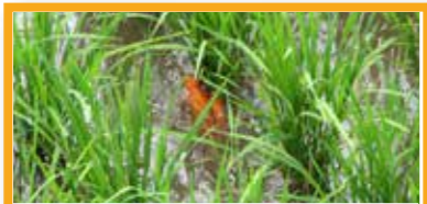
7 水田養魚 中国

田魚が水田の害虫や雑草を防いだり、代替肥料、食料、収入源になる2千年前から続くシステム