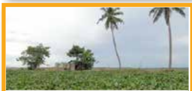
15 海抜下でのクッタナド農業システム インド

茶の原産地として1800年以上茶の木を養い、古代の茶道文化が継承されているシステム