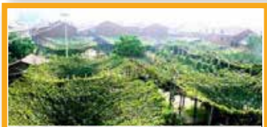
10 宣化のぶどう栽培の都市農業遺産 中国

田魚が水田の害虫や雑草を防いだり、代替肥料、食料、収入源になる2千年前から続くシステム