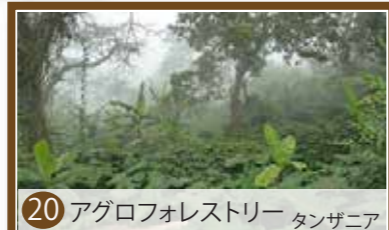
20 アグロフォレストリー タンザニア

マサイ・ダバド族により先住民の間で古くから伝わる慣習や伝統知識をもとに営まれる牧畜システム