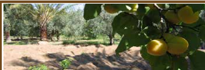
21 22 マグリブのオアシス チュニジア・アルジェリア

材木用の樹木やバナナの間でコーヒーや食用作物等多様な作物が栽培されているシステム