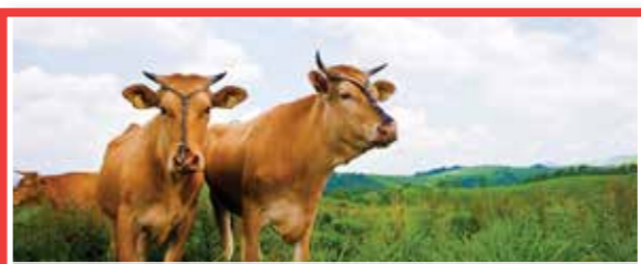
4 阿蘇の草原の維持と持続的農業 日本

静岡県の掛川周辺地域は、伝統的な「茶草場農法」が営まれています。これは茶園の近くにあるススキなどの草原(茶草場)の乾草(茶草)を茶園の土づくりに用いるもので、茶の品質を高めながら同時に半自然草地特有の生物多様性を保全しています。